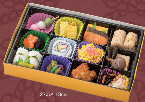
ごひいき弁当～幸～ 27.5× 18cm 1,296円(税別1,200円)