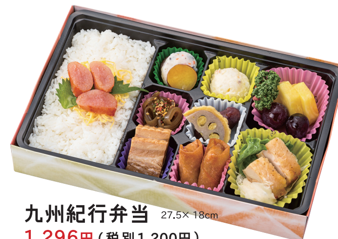
九州紀行弁当 27.5× 18cm 1,296円(税別1,200円)

(熊本) 辛子蓮根 (宮崎) チキン南蛮 (佐賀) いか焼売 (長崎) 中華春巻など 九州8県の名産入り。