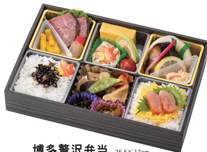
博多贅沢弁当 25.5× 17cm 2,160円(税別2,000円)