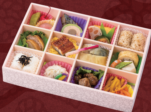
隅田川 27× 18.5cm 2,160円(税別2,000円)