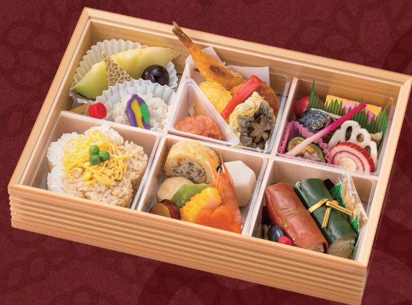
賑わい(にぎわい) 28.3× 20cm 3,240円(税別3,000円)