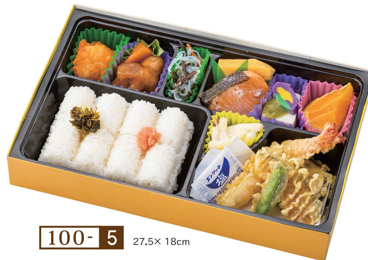
100- 5 27.5× 18cm