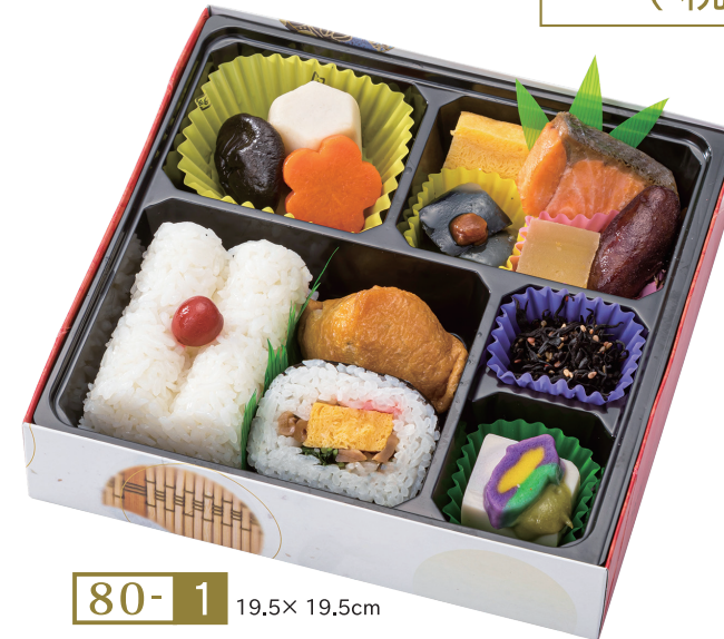
80- 1 19.5× 19.5cm 女性に好評！