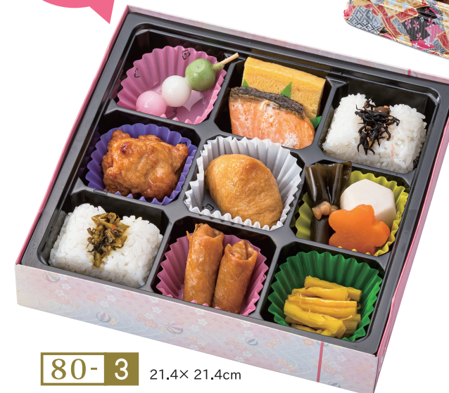
80- 3 21.4× 21.4cm