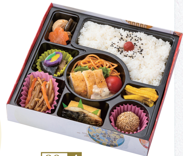
80- 4 19.5× 19.5cm