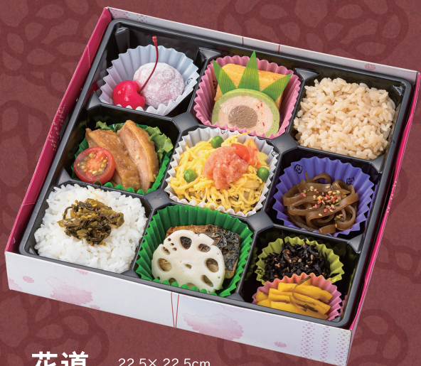
花道 22.5× 22.5cm 1,080円(税別1,000円)