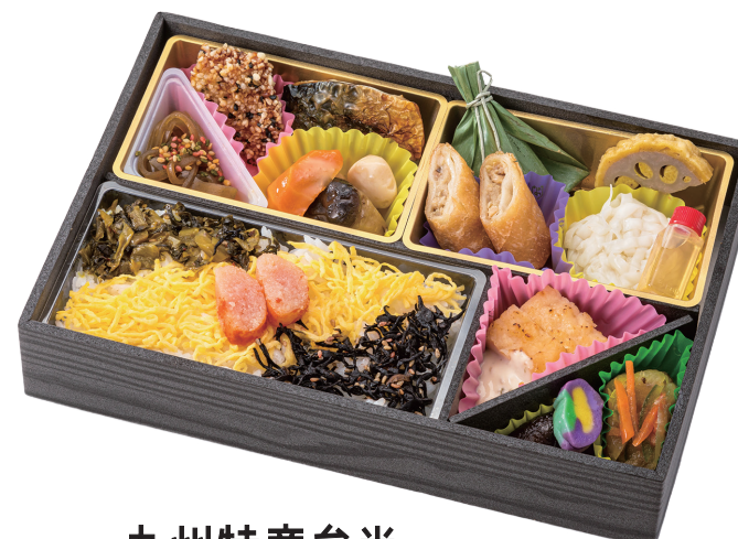
九州特産弁当 25.5× 17cm 1,620円(税別1,500円)