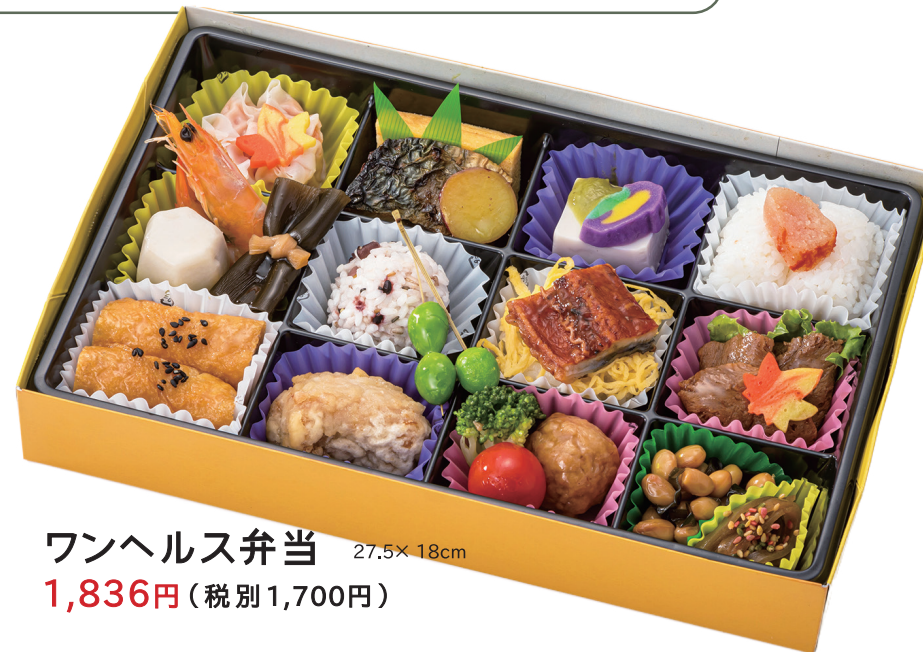
ワンヘルス弁当 27.5× 18cm 1,836円(税別1,700円)