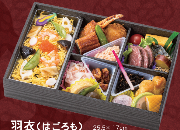
羽衣(はごろも) 25.5× 17cm 2,484円(税別2,300円)