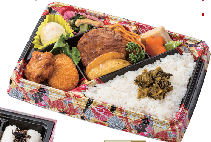
80- 2 26× 18cm 人気のハンバーグ弁当！