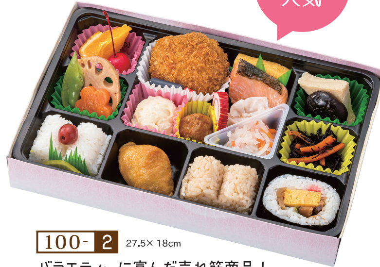
100- 2 27.5× 18cm バラエティーに富んだ売れ筋商品！