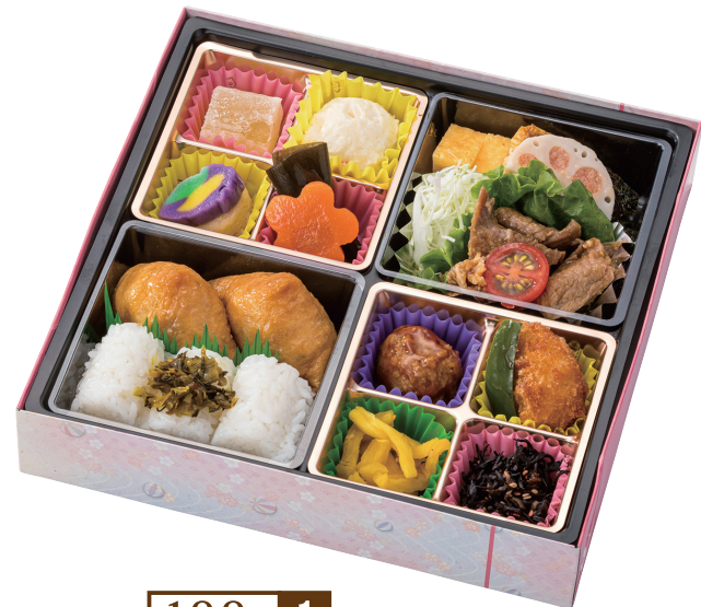
100- 1 21.4× 21.4cm 女性の集まりにオススメ。