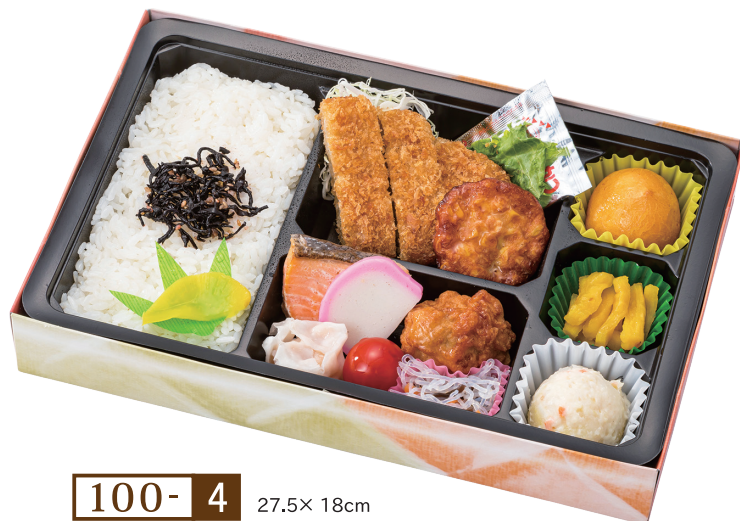
100- 4 27.5× 18cm