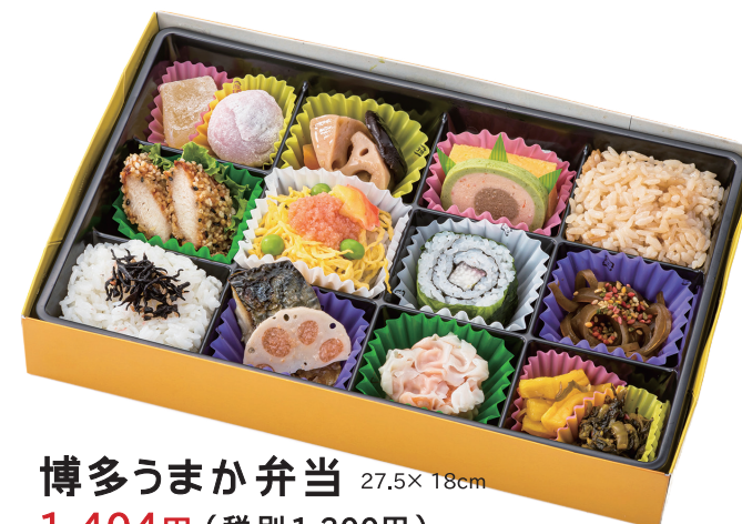
博多うまか弁当 27.5× 18cm 1,404円(税別1,300円)